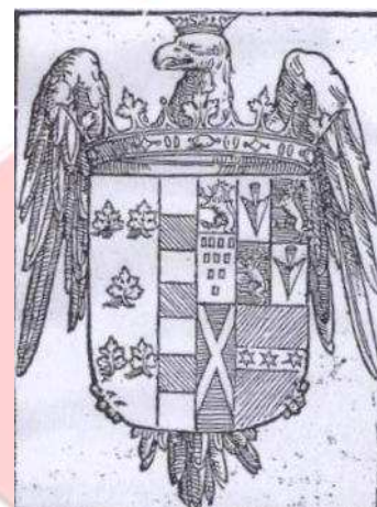
Blasón del I Duque de Feria

Muy cercano al príncipe Felipe, antes de ser cabeza de su Casa recibió la Encomienda de Beas de Segura (Jaén) que permutó posteriormente por la más rica de Segura de la Sierra (Jaén). Cortesano que no conocía la envidia, acompañó a Felipe en su periplo inglés como Capitán de su Guardia Española y fue posteriormente embajador en la Corte de Isabel I. también le acompañó durante la estancia del ya Felipe II en Flandes.