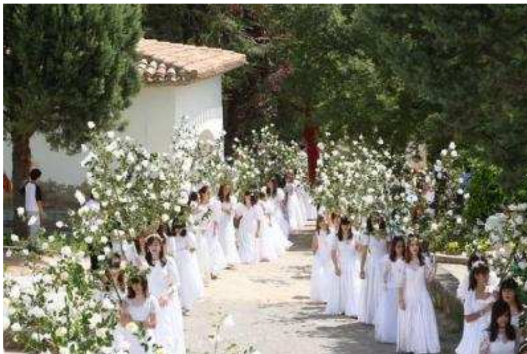
Procesión de las Cien Doncellas. Sorzano (La Rioja)

Todavía hoy se celebran fiestas en algunos lugares de España conmemorando la supresión de aquel odioso tributo. De esta forma, en Astorga se celebra la fiesta de la “Zuiza”, en León las “Cantaderas” y en Sorzano tiene lugar la romería de la Virgen de la Hermedaña, durante la cual unas jóvenes, vestidas de blanco y adornadas con ramas de acebo van en compañía de sus familiares hasta la Ermita de San Pedro.