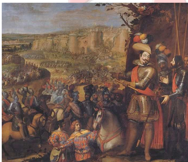
El Duque de Feria luce la banda roja de general y bastón de mando en la mano izquierda