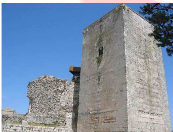
Torre del homenaje del Castillo de Estepa (SE)

Al ser residente habitual de Llerena consigue para la población la licencia para celebrar las ferias de San Mateo el 21 de septiembre, construye la capilla de la Trinidad en la Iglesia de la Granada, los bastimentos y termina el edificio destinado a Casa Maestral o el convento de Santa Elena.